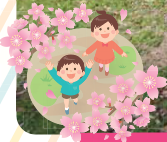
4月8日 さかえ公園にて撮影