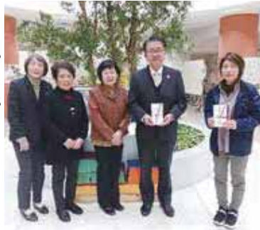
佐伯西組仏教婦人連盟